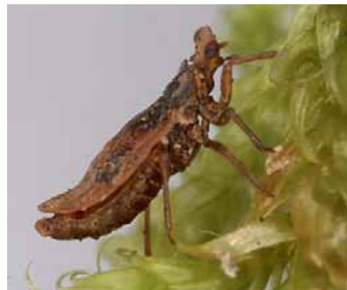
Hackeriella veitchi (erwachsenes Männchen).

Südhalkugel vorkommenden Scheinbuche) von Nord-Australien lebt. Im Sommer 2005 gelang es Jürgen Deckert mit Hilfe eines Kollegen vom Queensland-Museum etliche Exemplare von Hackeriella veitchi zu fangen und lebend nach Berlin zu bringen. Die urtümlichen Scheidenschnäbler (Coleorrhyncha), Schwestergruppe aller Wanzen, gehören einer alten Reliktgruppe von Gondwana-Insekten an. Im Bioakustiklabor des Museums gelang es uns, Vibrationssignale aufzuzeichnen, die durch ein primitives Tymbalorgan erzeugt werden. Diese Entdeckung deutet darauf hin, dass solche Signale schon von den frühen Vorfahren aller Zikaden und Wanzen benutzt wurden. Die »Gesänge« der Coleorrhynchen waren ein Element der akustischen Umwelt der Wälder im Zeitalter des Perm und haben sich seitdem wohl kaum verändert. ■